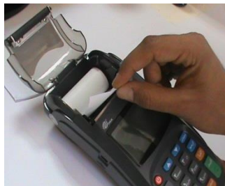
2- رول جدید را مانند تصویر درون دستگاه قرار دهید.