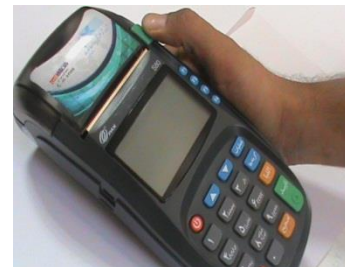
1- درب چاپگر را با فشار دادن ضامن آن به سمت بالا باز کنید