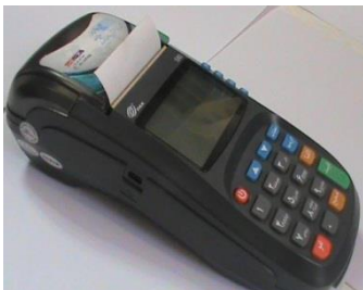
3- درب چاپگر را ببندید